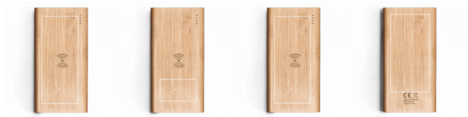
GRAVURE LASER Chargeur | Devant 50 x 30 mm