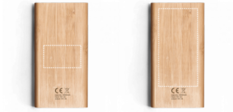
TAMPOGRAPHIE Chargeur | Verso 50 x 30 mm